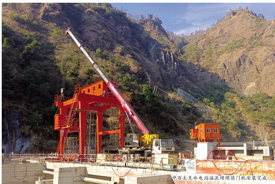
中百太克水电站溢流坝顶门机安装完成

随着最后一车混凝土入仓，数十名施工人员撸起袖子，铆足干劲，开始分层浇筑作业，大家分工有序、相互配合，一面手持振捣器均匀振实，一面迅速用抹抹子完成混凝土收面，以保证初凝前混凝土上、下两层的粘