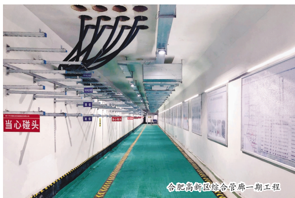
合肥高新区综合管廊一期工程

合肥高新区综合管廊一期工程的投入使用，打通了城市“大动脉”，有效解决了服务范围内马路拉链、空中蜘蛛网等问题，节省了城市用地、延长管线使用寿命，增强城市防灾减灾能力，促进城市集约高效和转型发展，提高城市综合承载能力和城镇化发展质量，助力合肥高新区实现新的城市梦想。