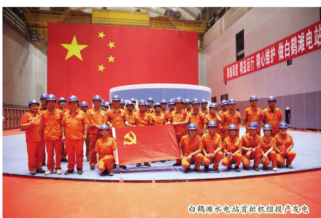
白鹤滩水电站首批机组投产发电