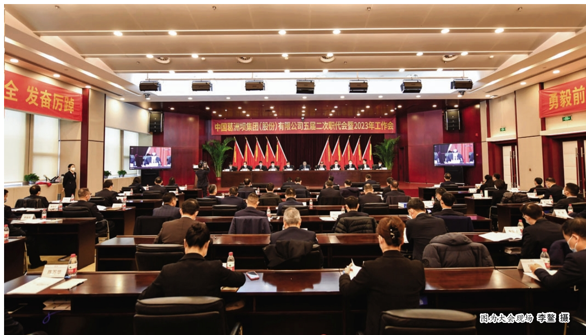
图为大会议现场

会议指出,中国能建第二次党代会是对《若干意见》和“1466”战略的延续和升华,对打造以新能源、新基建、新产业为核心的“三